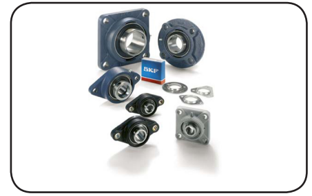
Berbagai pilihan housing : besi tuang kelabu dan lembaran baja

Silahkan tanyakan mengenai pilihan Y-bearing dan Y-bearing unit pada industri tertentu, mencakup industri makanan dan minuman serta pertanian, dan juga solusi untuk aplikasi rendah friksi.