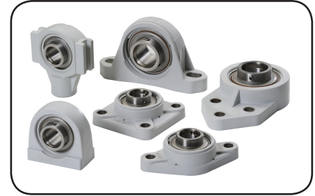
Bahan material meliputi stainless steel, komposit (terlampir)